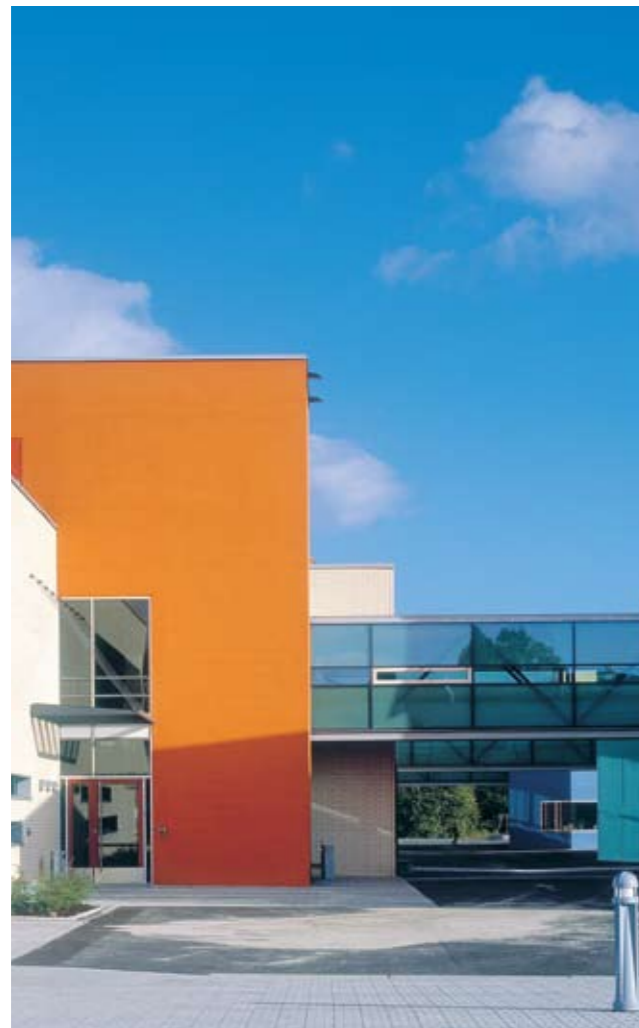
En riktig oppbygget og pusset vegg kan stå i 25 år uten vedlikehold.

Vi kjenner byggebransjen ut og inn. Vi kjenner våre kunders utfordringer. Nettopp derfor kan vi også hjelpe våre kunder til bedre prosesser, en enklere hverdag og ny vekst