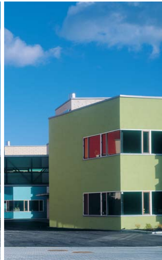
Grå og kjedelige murhus? Vi har et stort utvalg gjennomfargede sluttpusser.