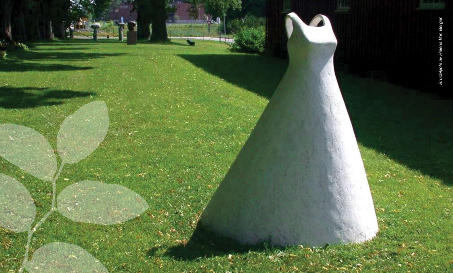
Brudekjole av Helena Von Bergen