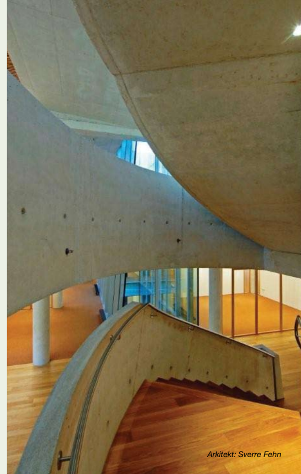
Arkitekt: Sverre Fehn